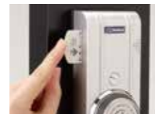
カードキー交換機能

鍵管理の省力化から一元化へ 空室キーを統一、鍵管理を簡単にする 賃貸経営に特化したカードキーシステム