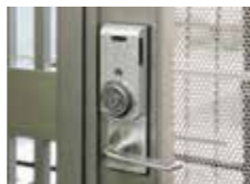
逆マスター設置機能

カードを差し込んでダイヤルを回すアナログ式。カードキーでありながら電源を使用しません。又、金庫をイメージしたデザインも、安心感を与えるひとつです。外部での設置にも耐え、鍵の管理を簡単にします。