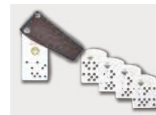
アナログ式カードキー

カードキーとは別に、物件所有者様向けにディンプルキーの機構があります。カードキーには貸借権、マスターキーには所有権と物理的な権利分けを行うことで、フレキシブルに運用することが可能です。マスターキーにも変換機能を持たせることで本体を変えることなく設定変更できます。