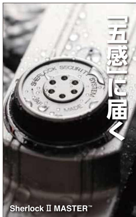
Sherlock II MASTER™

住まう人、使う人には心からの安心を オーナー様や管理会社には業務の簡素化とコスト削減を 堅牢と精密をイメージしたシャーロック